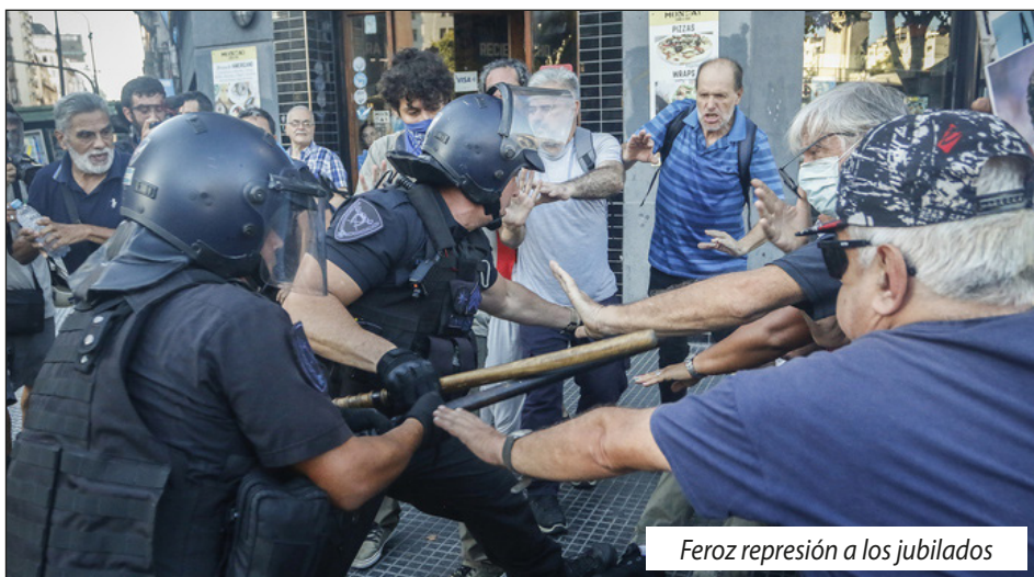
Feroz represión a los jubilados

Para derrotar a Milei y el plan de colonización del imperialismo de la Argentina de hoy, ¡hay que romper con los políticos patronales que siempre fueron enemigos del pueblo!