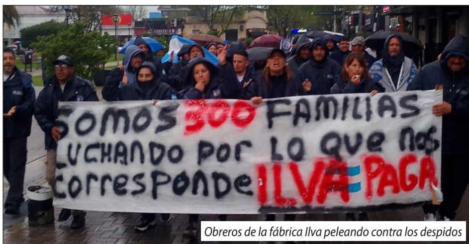
Obreros de la fábrica Ilva peleando contra los despidos

Su burocracia sindical aplica la liquidación de la garantía horaria aceptando despidos y suspensiones en masa, y negociaciones salariales miserables por fábrica como en las automotrices y siderúrgicas, e inclusive sección por sección vía pequeños premios, etc., a cambio de entregar la polifuncionalidad en las tareas.