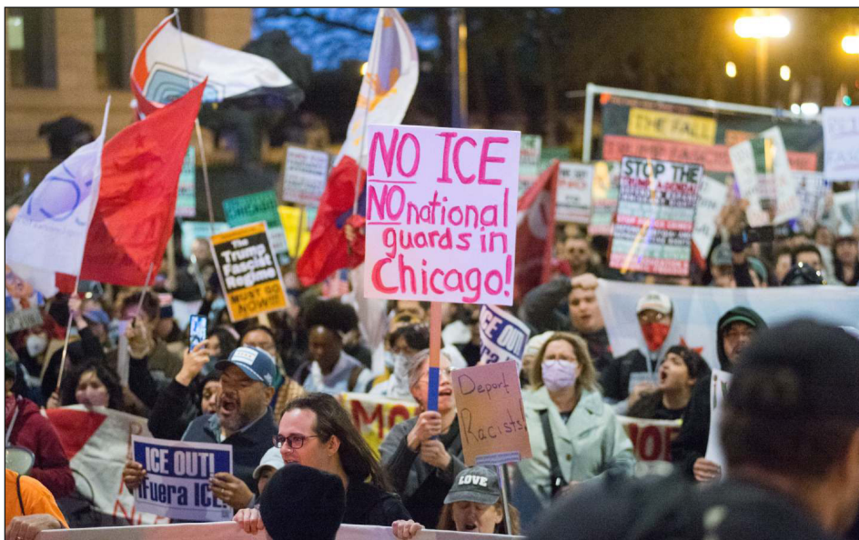
EEUU: movilización en Chicago contra el carnicero Trump en defensa de los migrantes

combaten en el corazón de la bestia imperialista. Allí se juega en gran medida hoy la suerte de Latinoamérica. Esta pelea se define en la lucha de clases en todo el continente: ¡una misma clase, un mismo enemigo y una misma lucha antimperialista!