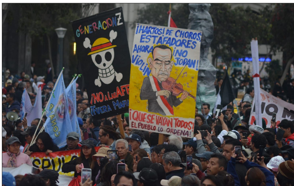
Movilización de masas en Lima al grito de "¡Que se vayan todos!"

rolló durante casi dos meses una enorme oleada de luchas encabezadas por la juventud obrera y los estudiantes combativos con epicentro en la capital Lima, pero también hubo movilizaciones masivas en