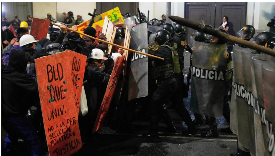
La juventud obrera y estudiantil enfrenta la represión de la policía asesina

Si logran sacar a las masas de las calles e impiden que la clase obrera dé una salida acaudillando en la lucha revolucionaria al campesinado pobre, las clases medias arruinadas y todos los sectores oprimidos de la sociedad, la salida la va a