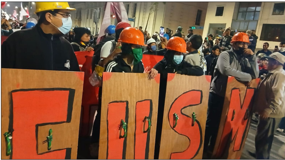
Estudiantes de la Universidad Mayor de San Marcos en la jornada del 15/10

La juventud obrera y estudiantil, desde sus colectivos y organismos autoorganizados, tienen toda la autoridad para llamar