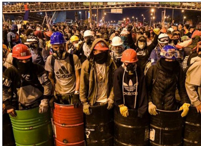
2021: Primera Línea de los combates revolucionarios de Colombia

Hay que volver tras los pasos del embate revolucionario de 2019-2021, pero esta vez sin dirigentes traidores que someten a la