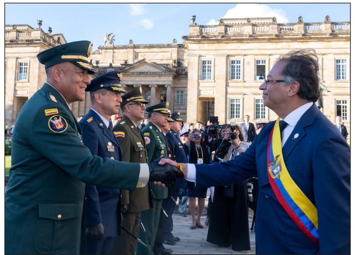
Petro con las FFAA asesinas de Colombia

Esto es una falsedad a todas vistas, luego de los golpes y masacres en Perú y Bolivia, los caídos y asesinados en los levantamientos de Colombia y de Chile, y los bombazos que los marines norteamericanos arrojan en el Caribe. Los yanquis iniciaron en Los Ángeles y todo EEUU una guerra abierta contra los hispanos migrantes, con millares de reprimidos y detenidos.