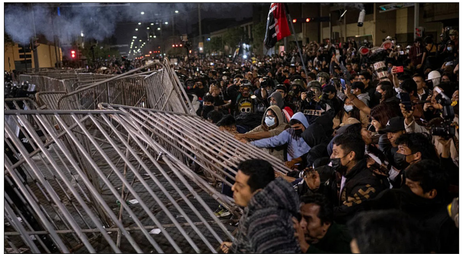
15 de octubre: combates alrededor del Congreso

En esta jornada, la juventud obrera y estudiantil concentró su combate nueva-