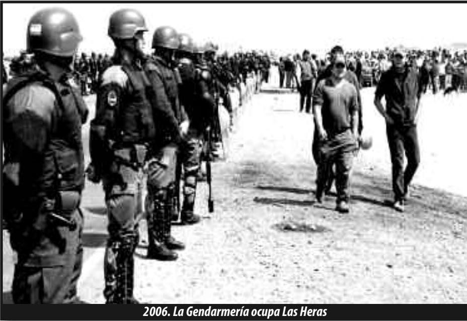
2006. La Gendarmería ocupa Las Heras

ellos, durante estos siete años, aquellos testimonios estaban guardados en los cofres de la represión y el silencio, en la oscuridad de la amenaza y la tortura. Eso se ha acabado.