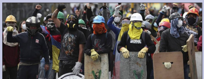
Primera Línea de los combates revolucionarios de 2021 en Colombia