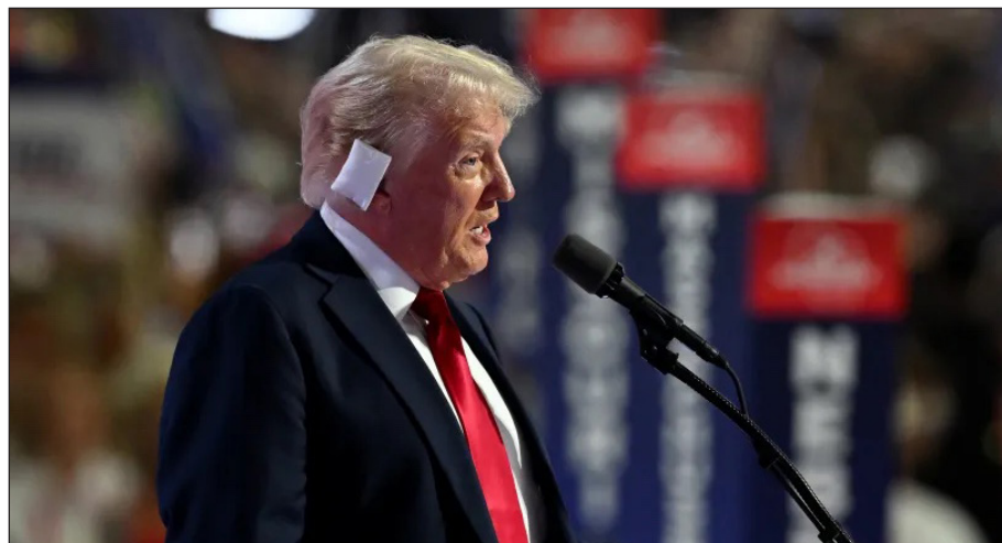
Trump en la convención del Partido Republicano con el rasguño en su oreja

La primera intención del FBI fue afirmar que este fue un "acto terrorista". Esta versión duró apenas unas horas. Los medios burgueses imperialistas hacían trascender que supuestamente el atacante era un "miembro antifascista", buscando responsabilizar a las organizaciones de