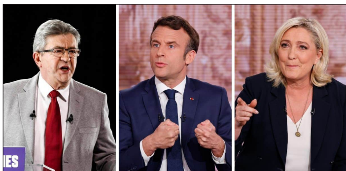
Mélenchon, Macron y Le Pen

¡Que vuelva la Comuna de París en toda Francia!