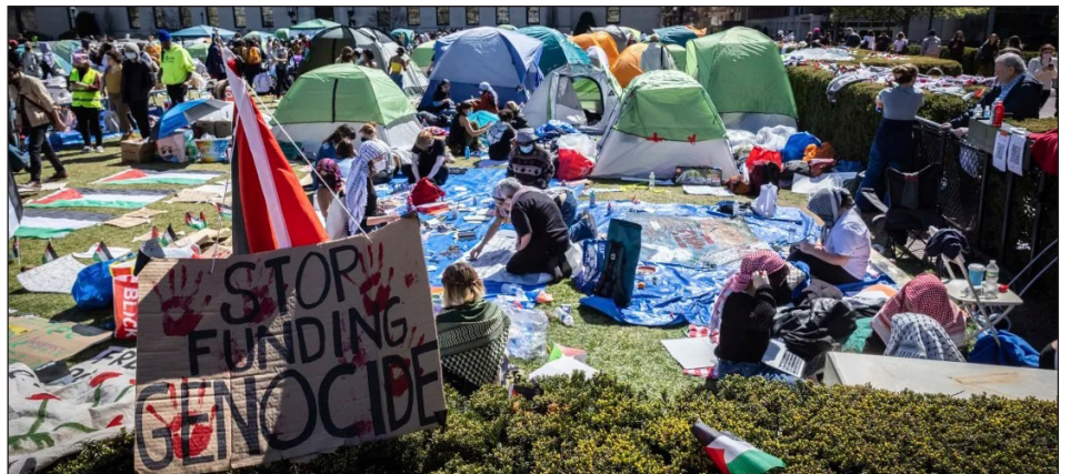
Acampe de estudiantes en los campus universitarios de EEUU en apoyo a Gaza: “Basta de financiar el genocidio”