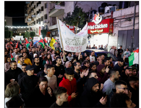
Marzo 2024: marcha en Ramallah contra la masacre del sionismo en Gaza

Ahora, esta misma OLP anuncia que propone un “gobierno de unidad nacional”. Pero, ¿en qué nación? Ellos reconocen al estado de Israel, mientras la nación palestina está sometida a verdaderos guetos y bantustanes. Al Fatah se ha vendido por dos monedas al ocu-