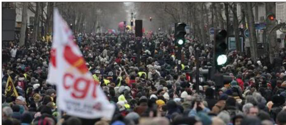
Manifestaciones masivas contra el ataque a las jubilaciones, febrero 2023

inmigrantes, a los sectores más pauperizados que el fascismo se para formando parte de un “frente democrático” con los enemigos de clase. Este es el mayor engaño y trampa, esta política de bloques “progresivos”, de apoyar al mal menor y de sumisión a la burguesía. La política de “todos contra Le Pen” significa apoyar al PS y a Macron que son los que reventaron a la clase obrera... Es decir, ¡a los que fortalecieron a Le Pen! Y por otro lado, de la mano de los que nos arrancaron las conquistas, jamás podremos recuperarlas.