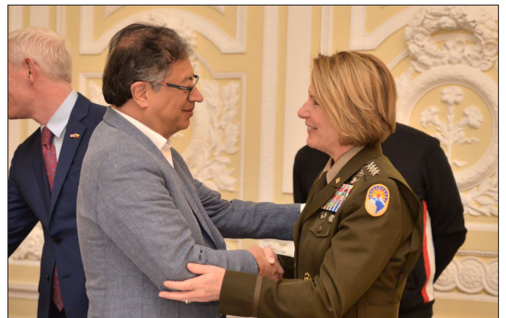
Petro y la generala Richardson del Comando Sur yanqui

Esa República Obrera y Campesina, basada en consejos de obreros campesinos armados, sería la más democrática puesto que agruparía a la mayoría de la nación contra la minoría de parásitos y saqueadores.