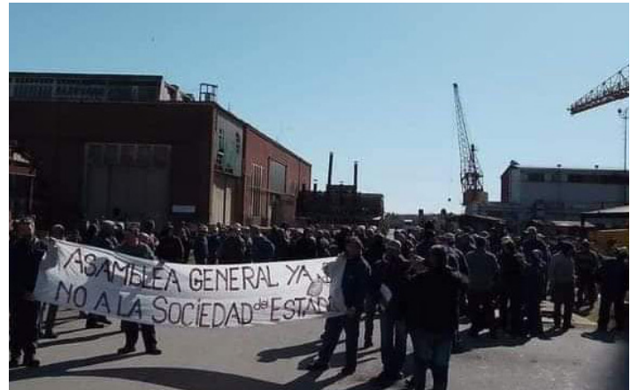
2022. Obreros autoconvocados del ARS

¿Las están reservando para dárselas a las petroleras y gasíferas imperialistas que vienen a saquear Vaca Muerta, al Paraná invadido por seis mil ingenieros del ejército de EEUU y las materias primas que el gobierno de Milei roba para Biden, los yanquis y el FMI?