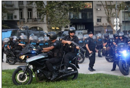
12 de junio. Represión frente al Congreso

Llamamos a todas las organizaciones que pelean en todo el mundo por la libertad de los presos políticos, a los que