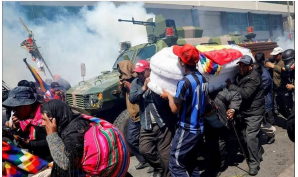
2019: represión al cortejo fúnebre de los mártires de Senkata