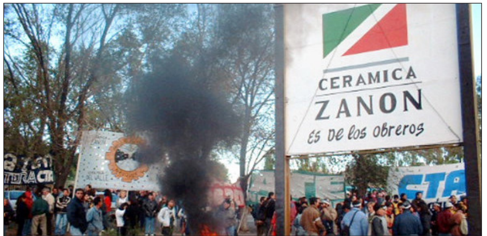
2001: corte de ruta de obreros de la fábrica Zanon, tomada por sus trabajadores

La patronal amenaza y ya impone suspensiones, despidos y cierres de fábrica, para que la clase obrera se rinda en su lucha por el salario y avance la flexibilización