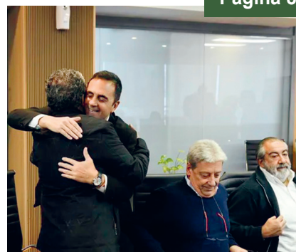
La burocracia de la CGT junto al Secretario de Trabajo, ex CEO de Techint

GUERRA A LOS TRABAJADORES Y SAQUEO DE LA NACIÓN