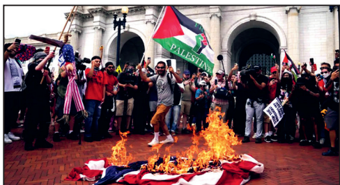
EEUU: quema de la bandera yanqui en apoyo a Gaza

Por un Comité de Lucha y Coordinación Internacional en solidaridad con la resistencia palestina