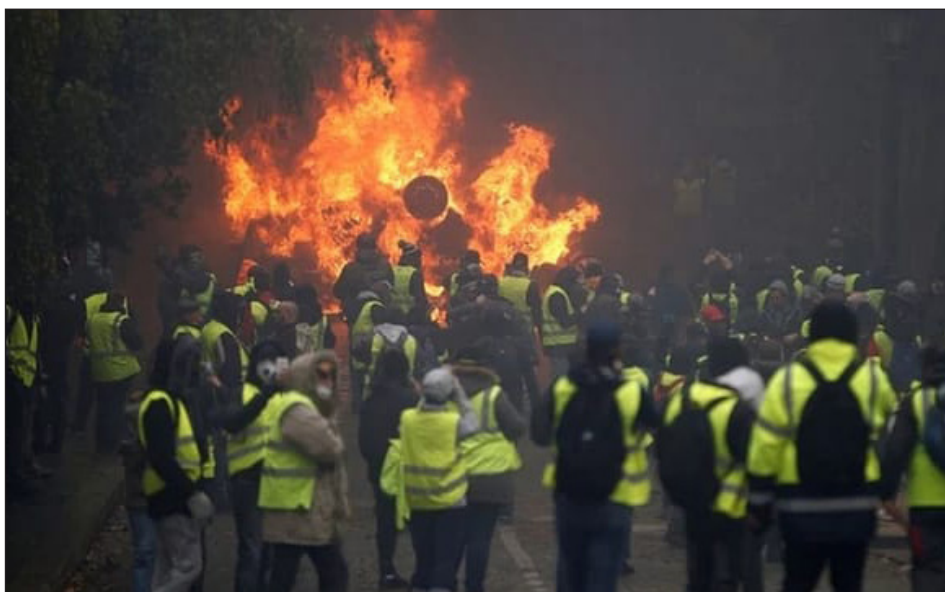
Barricadas de los "Chalecos Amarillos" contra el impuestazo de Macron, 2018

se llevan todas las riquezas del mundo colonial. ¡Que la crisis la paguen los capitalistas y los banqueros! ¡Abajo las 30 familias dueñas de los grandes grupos económicos de Francia!