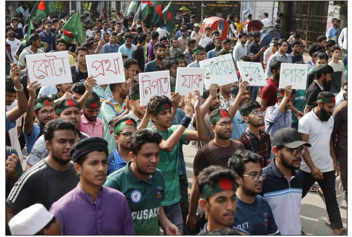
Movilización de estudiantes en Bangladesh

mediante hackeos a los sitios web institucionales y reduciendo a cenizas el edificio del canal de televisión estatal.