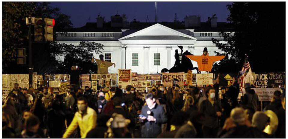
2020: la Casa Blanca rodeada por el movimiento negro y los trabajadores sublevados

Insistimos, no hay ninguna corriente obrera, ni sindicato, ni corriente socialista o de izquierda, que aplique un método de respuesta individual ante los opresores en EEUU. Es más, la mayoría absoluta de las direcciones de estas organizaciones están integradas al régimen, como es el caso del sionista Sanders y de Ocasio-Cortez. Ellos apoyan abiertamente al carnicero Biden,