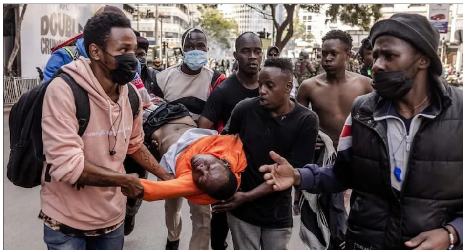
Los combates en las calles de Kenia han dejado 22 muertos

campesinos pobres y a la juventud combativa, tiene que tomar en sus manos la resolución de sus penurias y la liberación de sus cadenas, expulsando al FMI y rompiendo todos los lazos con el imperialismo.