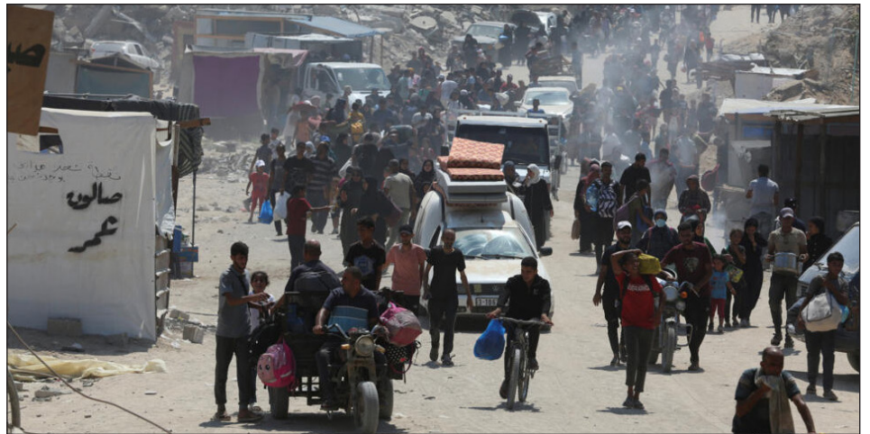
Desplazados en Gaza

había intentado un "plan de paz" para conseguir en la mesa de negociación lo que no pudo en el campo de batalla, es decir, la rendición de la resistencia palestina. Su plan de "alto al fuego" dejaba al sionismo ocupando Gaza y dispuesto a continuar la masacre ni bien se libere el último rehén. Pero hasta ahora Hamas no lo aceptó. La resistencia no se rindió, sigue combatiendo y no acepta ningún alto al fuego que no incluya una retirada del sionismo, lo que significaría una derrota militar para el gendarme del imperialismo, que no está dispuesto a aceptar. Ahora avanzan en el exterminio final para terminar de aniquilar Gaza y la resistencia palestina.