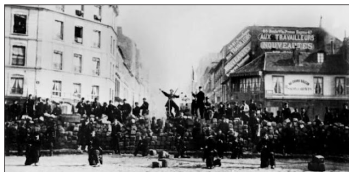
Barricadas durante la Comuna de París en 1871

Las elecciones del parlamento de la Unión Europea realizadas el 9 de junio, desataron una crisis importante para el gobierno de Macron. Rassemblement National (Agrupación Nacional) -partido de ultra derecha liderado por Marine Le Pen- obtenía una amplia victoria y el Partido de Macron, presidente francés, quedaba en tercer puesto. Por lo cual este convocó de forma