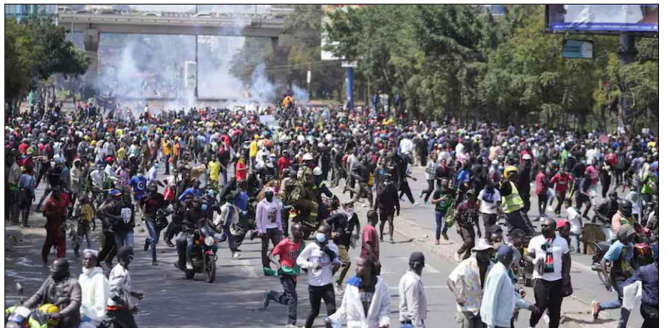
Las masas se sublevan en Kenia

Así, el martes 25 de junio, en Nairobi, capital de Kenia, y también en ciudades como Mombasa, Kisumu, Eldoret, Nyeri y Nakuru, miles de jóvenes y trabajadores ganaron