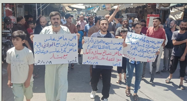
Marcha en Ariha, provincia de Idlib exigiendo la caída del gobierno del HTS

Corresponsal de “La Verdad de los Oprimidos”