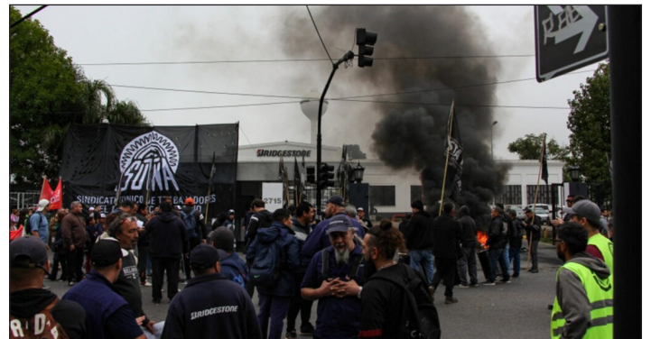
Manifestación frente a la planta de Bridgestone

Y si los patronales esclavistas no pueden dirigir sus negocios sin parar la producción, despedir y suspender obreros, ¡córranse! Contra los “empobrecedores” de la nación, hay que estatizar toda la rama del neumático, sin pago y bajo control del SUTNA y los comités de base .