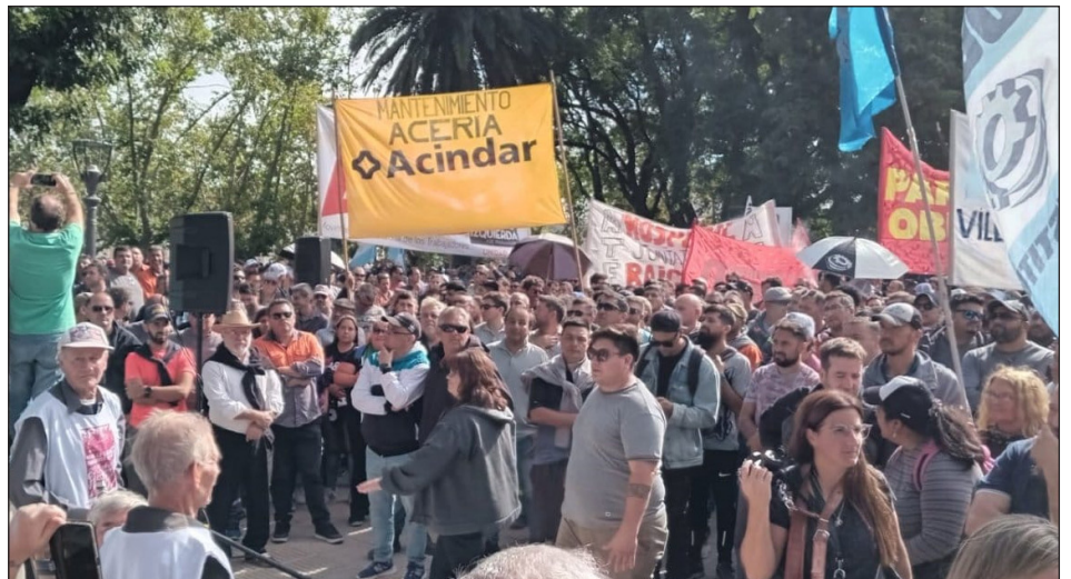
11 de abril de 2024. Paro y movilización de metalúrgicos de Villa Constitución

Todavía no cobramos las paritarias adeudadas de abril-mayo-junio (7.5%; 3.6%; 3.6% respectivamente) y Furlán ya se juntó con los empresarios para negociar