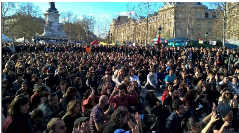
Asamblea en la “Plaza de la Comuna” contra la reforma del código de trabajo del gobierno de Hollande, 2016

Y le hacen creer a la clase obrera, a los