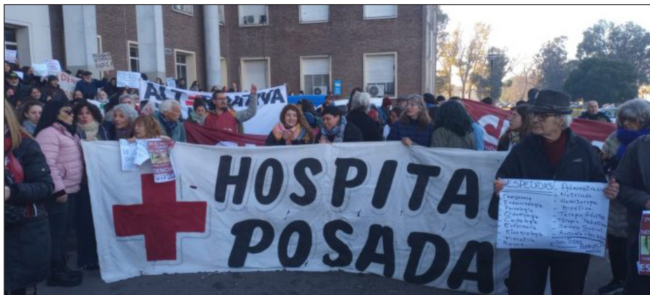
Trabajadores del Hospital Posadas en lucha

Cuando la burguesía y su gobierno han largado un feroz golpe económico, ahora hiperrecesivo para chantajear a la clase obrera con miles de despidos, las demandas mínimas no pueden ser otras que luchar por un salario mínimo, vital y móvil de $1 millón y medio, indexado mensualmente según el costo de vida.