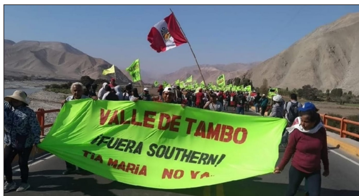
Arequipa: paro contra el proyecto minero Tía María

Todo lo demás es una burda trampa que montan estas direcciones para seguir sometiendo a las masas al régimen y garantizando que Dina se quede. Hay que decir la verdad: si hoy Boluarte, con sus secuaces golpistas del Congreso, tienen las manos libres para redoblar su ofensiva contra los explotados es gracias a la burocracia de la CGTP y todos los sectores burgueses que hoy hablan de