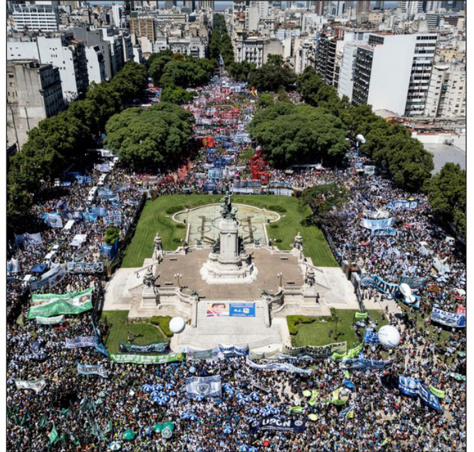
Paro y movilización el 24 de enero

▪ Junio de 2024: se aprobó la Ley Bases. El peronismo le prestó los senadores que el gobierno necesitaba y la burocracia kirchnerista de Moyano y las CTA abandonó la plaza. A ello le siguió una represión salvaje con más de 30 detenidos. Todo fue orquestado por los políticos patronales y la embajada yanqui.