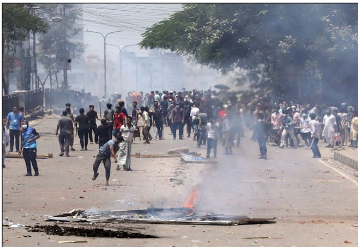
Estudiantes chocan con la policía antidisturbios durante una protesta contra el sistema de cuotas del gobierno en Daca

La situación se radicalizó aún más cuando el gobierno -que acusó de razakar (cipayos) a la vanguardia estudiantil- decidió declarar el toque de queda; la interrupción del servicio de internet, para intentar impedir la organización de las protestas; y reforzar la represión con militares en las calles, disparando a matar. El estado asesino, por orden de Hasina, se cobró hasta ahora las vidas de al menos 130 manifestantes (muertes de las cuales no se responsabiliza) y tomó como rehenes a centenares, encerrándolos en cárceles, intentando así mitigar la intensidad de los levantamientos, que lejos de cesar, desobedecieron el toque de queda, y redoblaron los enfrentamientos por todas las vías posibles, inclusive