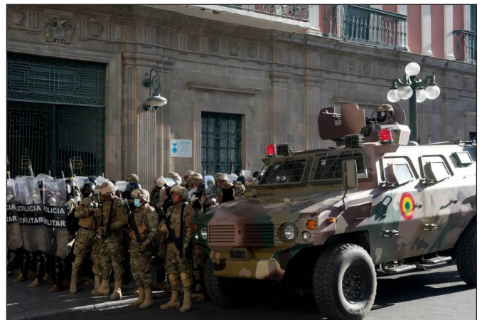
Militares armados toman la Plaza Murillo

▪ Para tener pan, educación, salud y jubilación digna: ¡Nacionalización sin pago y bajo control obrero de los hidrocarburos, el litio y demás minerales! ¡Expropiación de las tierras a la oligarquía terrateniente de la Media Luna sin indemnización alguna!