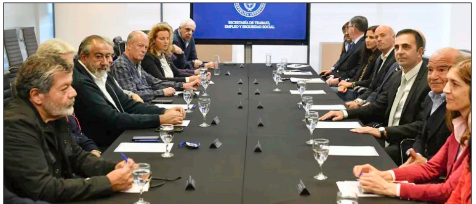
La burocracia de la CGT reunida con la Secretaría de Trabajo de Milei