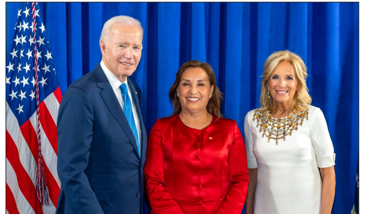
La asesina Boluarte junto al carnicero Biden

Esta es la respuesta de este gobierno asesino en momentos en que la “ Organización Nacional de familiares de los asesinados y víctimas de la masacre 2022- 2023 ”, de la que son parte los familiares de la masacre de Juliaca, están convocando a un “Paro y marcha nacional” el 27, 28 y 29 de julio para marchar a Lima contra el gobierno.