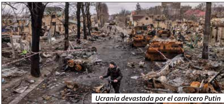
Ucrania devastada por el carnicero Putin

¡Hay que unificar las filas de la clase obrera del Donbass a Kiev y expropiar a los expropiadores del pueblo para poner todas las riquezas al servicio de derrotar al invasor!