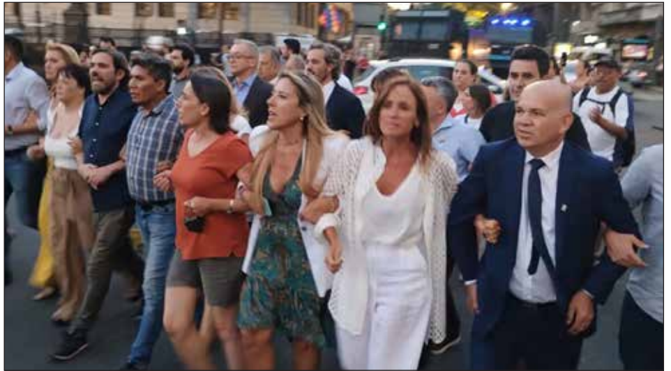
Diputados del FIT-U junto a los del kirchnerismo afuera del Congreso en Argentina

Hablemos claro... Algunos incluso se venían preguntando "cómo construir un partido revolucionario en una época reformista". Pero cuando la crisis les pega dos sopapos y las balas les zumban cerca de la cabeza, enseguida se ponen a hablar de "crisis económica" y "guerra". Puras palabras y fuegos de artificio.