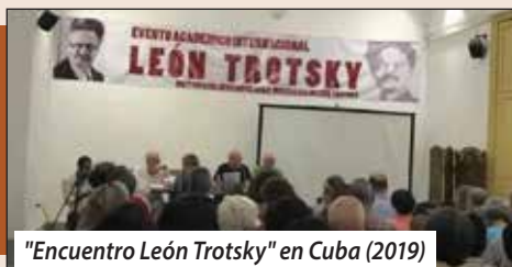
"Encuentro León Trotsky" en Cuba (2019)

Ver todas las declaraciones de la FLTI sobre la llamada "Internacional Progresista" en nuestro periódico digital: