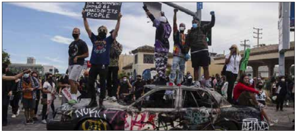
Sublevación en EEUU contra el gobierno de Trump en 2020

Durante el gobierno de Biden, los inmigrantes fueron brutalmente atacados y encarcelados a una escala superior a la del primer gobierno de Trump. La columna de miles de inmigrantes intentando entrar a EEUU, meses atrás, fue contenida con las