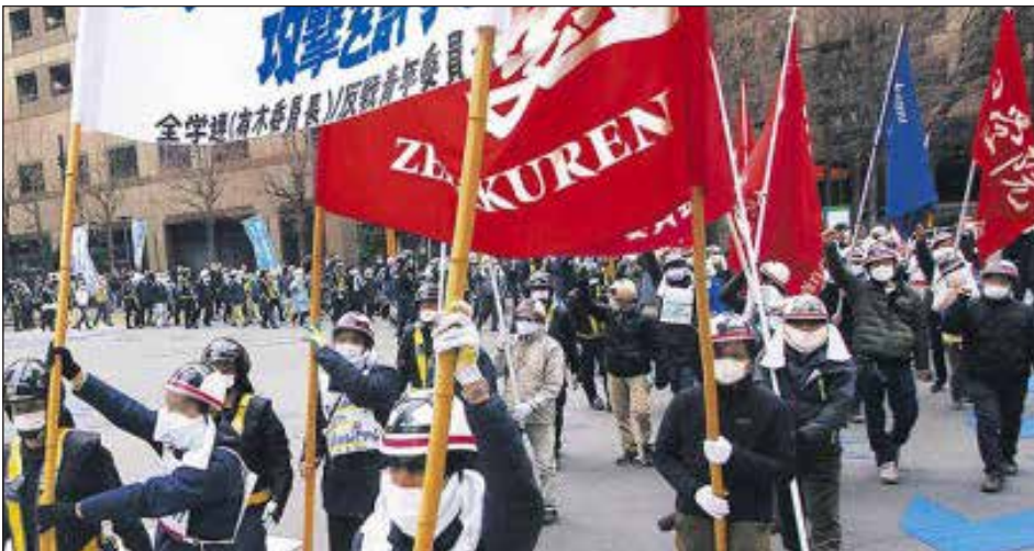
24 de febrero de 2023, Tokio: movilización contra la invasión de Putin

“Solo la lucha de los trabajadores del mundo puede detener la guerra. (...) La vanguardia revolucionaria que enfrentando al imperialismo y al stalinismo es la que puede dirigir esta lucha”