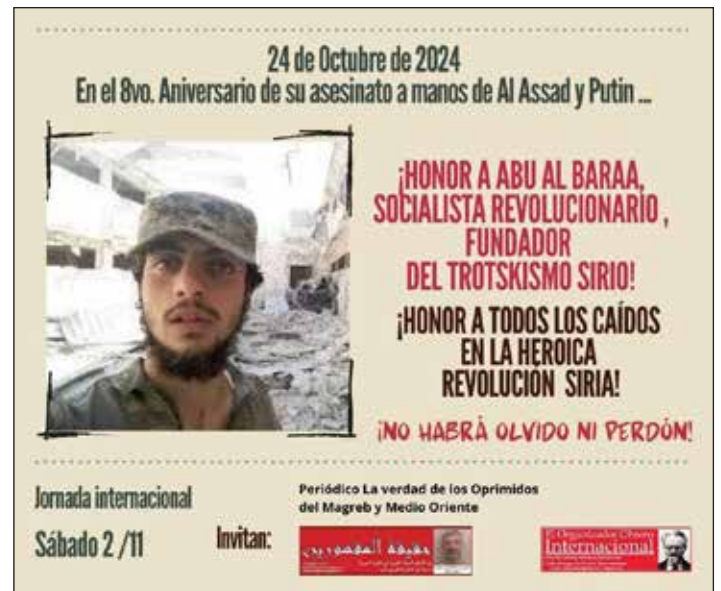
Flyer de convocatoria a la jornada internacional

Las masas palestinas tienen un gran aliado que son los trabajadores y el pueblo de Yemen, porque allí también hubo una enorme revolución.