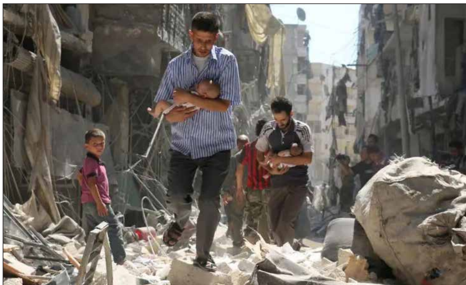
Masacre a la revolución siria

Más allá de sus diferencias y sus distintas ubicaciones en las trincheras, todos los participantes de este encuentro tienen pleno acuerdo en silenciar que lo único que puede resolver la cuestión de la guerra es la victoria de la revolución.