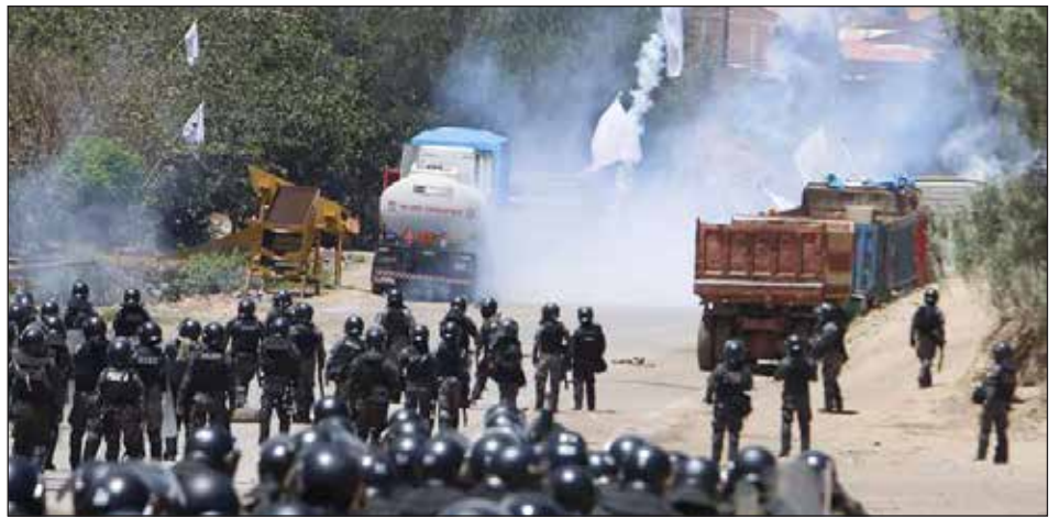
Represión de la policía a los campesinos

Por la expropiación sin pago de los bancos para los dólares que entren o salgan estén bajo el control de las organizacio-