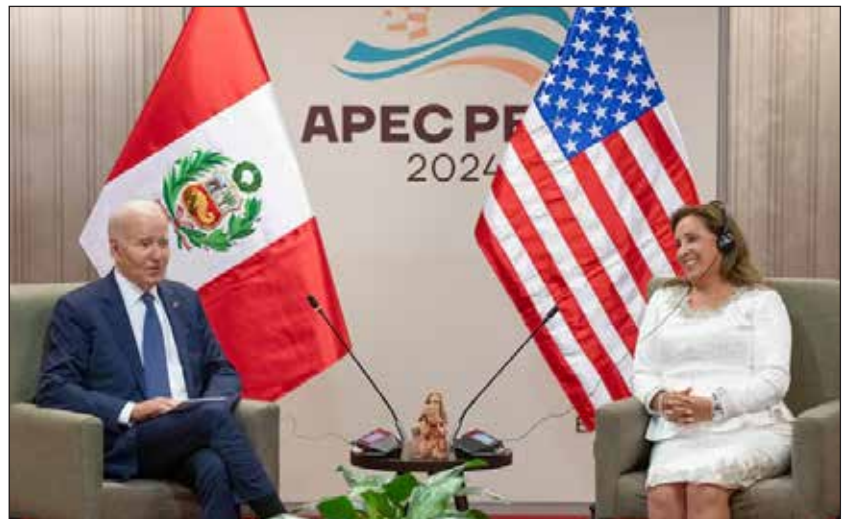
Boluarte y Biden reunidos en Lima durante la Cumbre APEC 2024

¡Por un Congreso Continental de las organizaciones obreras y campesinas para impulsar una lucha unificada junto a los obreros de EEUU para expulsar al imperialismo y a sus gobiernos y regímenes cipayos!