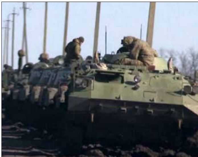
Tropas rusas ingresan al este de Ucrania

En la Primera Guerra Mundial les decíamos a los obre-