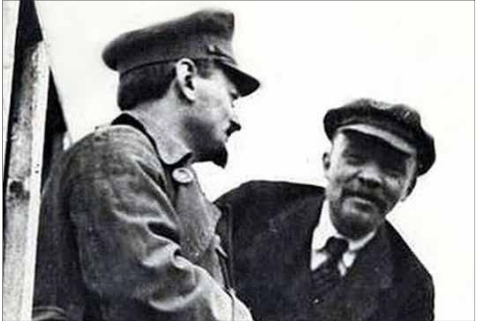
Lenin y Trotsky

Ayer el stalinismo falsificó a Lenin, castrándole todo su contenido revolucionario. Hoy son los ex trotskistas lo que hacen lo mismo con el camarada Trotsky para que no quede piedra sobre piedra de la IV Internacional y su programa, a la que estas corrientes liquidaron llevando sus limpias banderas al fango de la colaboración de clases para marchar a partidos únicos con el stalinismo, como quedó claro en Buenos Aires, borrando el río de sangre que se-