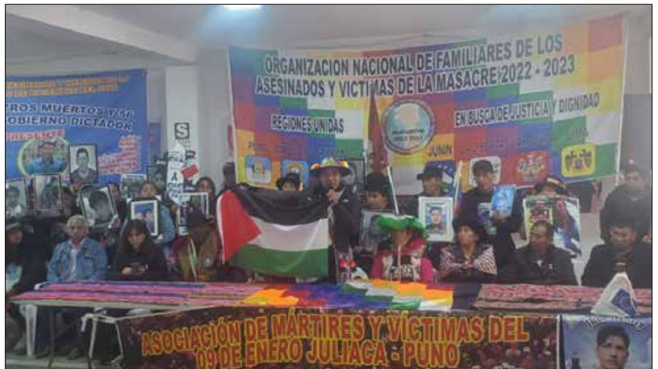
Julio de 2024: la "Organización Nacional de Familiares de los Asesinados y Víctimas de las masacres de 2022-2023" se solidariza con las masas palestinas

Hay que tomar en nuestras manos este combate, realizar asambleas en los lugares