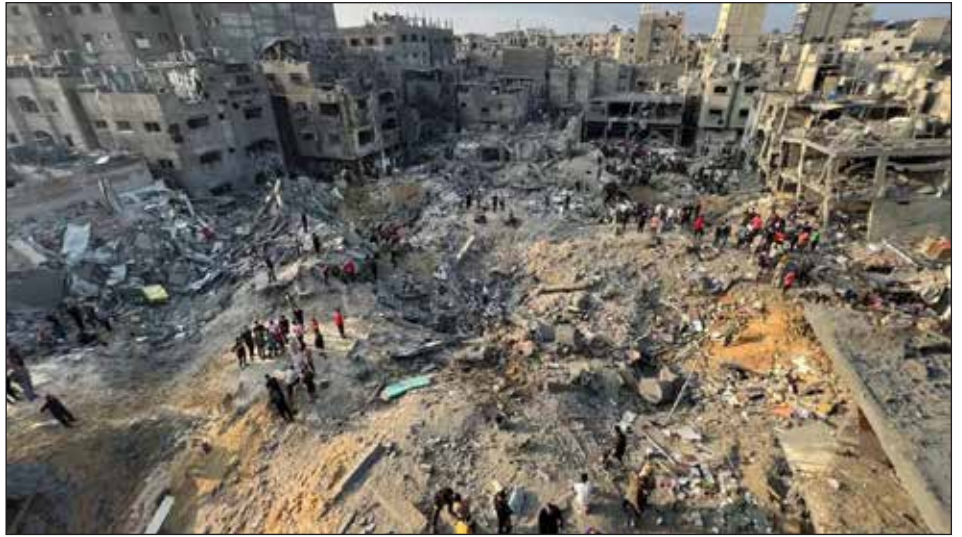
Gaza devastada por la ofensiva genocida del sionismo y los yanquis

Por eso, la llave del triunfo solo la tienen las masas armadas, atacando la propiedad del imperialismo y los capitalistas en acciones independientes. Ellas pondrían a producir la tierra y toda la economía para que el pueblo de Gaza hambriento pueda alimentarse. Dejarían sin comida a los hombres de negocios para que coma el pueblo palestino. La burguesía le tiene terror al ingreso de las masas a la guerra civil contra el sionismo y el imperialismo, de forma generalizada e independiente.