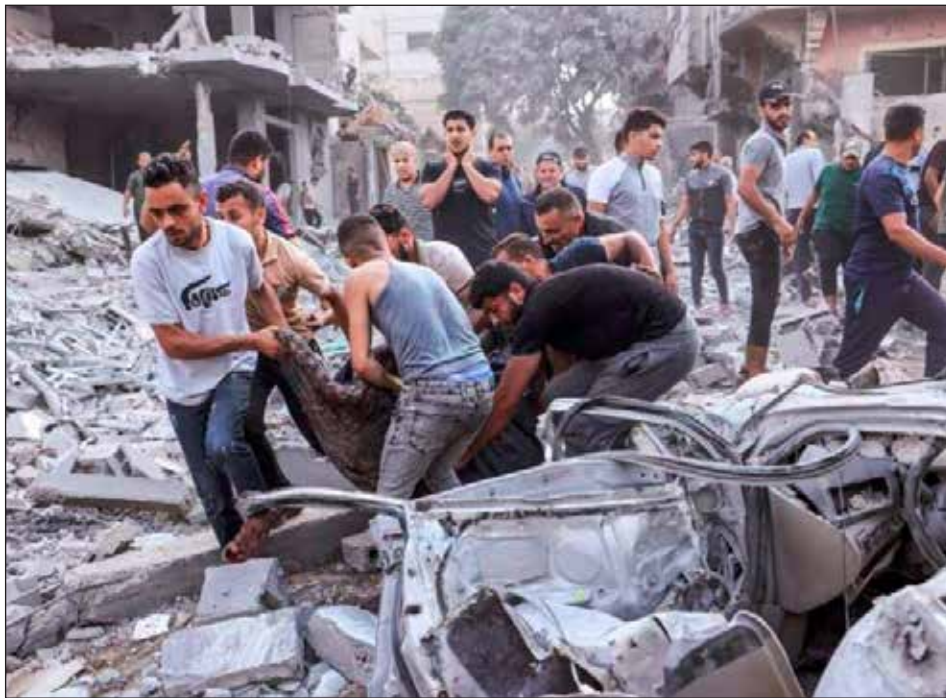
Masacre del sionismo en Gaza

“La jornada es un paso adelante por reanudar la continuidad teórico-programática-organizacional del marxismo revolucionario...”