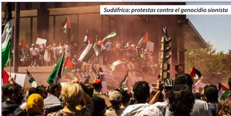
Sudáfrica: protestas contra el genocidio sionista

Rendimos homenaje a los mártires de la resistencia palestina, a Abu Al Baraa, socialista revolucionario y fundador del trotskismo sirio, y a todos los mártires sirios, a los mineros masacrados de Marikana. (...)