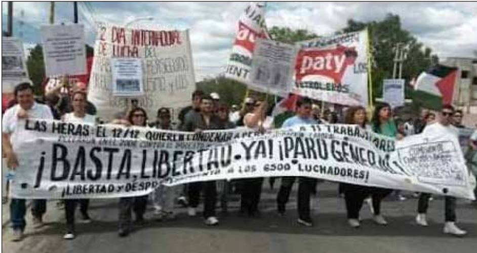
Marcha por los presos políticos en Las Heras

“Nuestro corazón siempre estuvo y está con Palestina porque con ellos también enfrentamos al tribunal de las petroleras que nos condenaron”