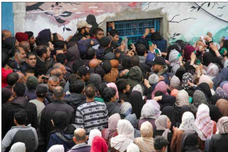
Protestas por el hambre en Gaza

La franja de Gaza es una zona demolida y destruida, con sus edificios y campos agrícolas totalmente arrasados y envenenados con fósforo blanco, donde el ocupante fascista ha arrojado a dos millones de palestinos a vivir en un calvario. Los que sobreviven vagan de una ciudad fantasma a otra, de un campamento de refugiados destruido a otro, y últimamente, ya casi ni le quedan elementos para buscar techo y duermen a cielo abierto. 85.000 toneladas de bombas han caído sobre Gaza. El hambre ya no se soporta más. Ya no les queda ni el pienso para animales, ni siquiera los yuyos y hierbas. Todo se comió hace rato o fue destruido y no les llega nada, porque el cerco de los nazi-sionistas no lo deja entrar. El sionismo utiliza así, además, un poderoso misil contra las masas palestinas: el hambre.