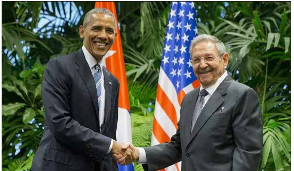
2016: Obama y Raúl Castro en Cuba