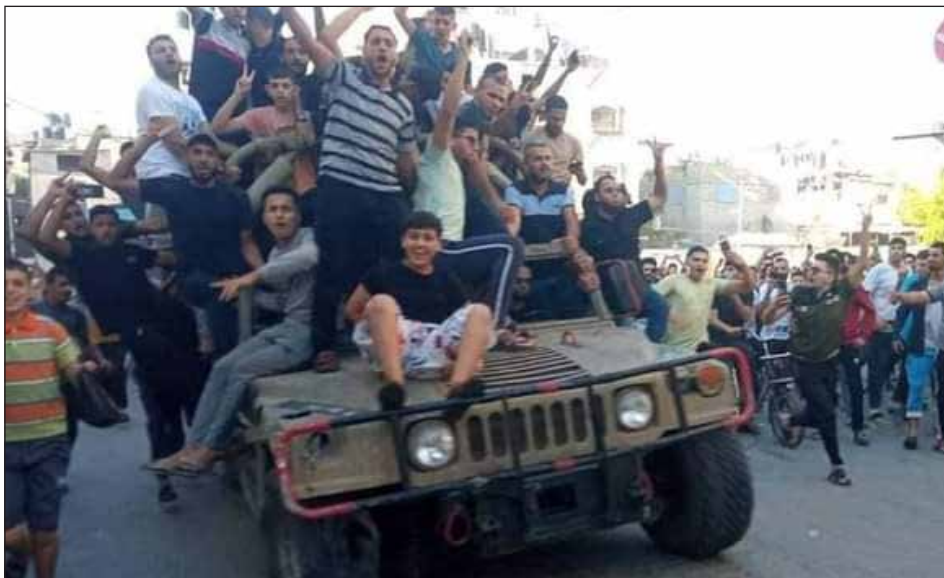
7 de octubre de 2023: acción de autodefensa del pueblo palestino

Mientras Hamas intenta negociar y pone como sus aliados a las burguesías árabes e iraní, nosotros estamos por la sublevación de la clase obrera con sus hermanos de Gaza masacrados, por que se abran los