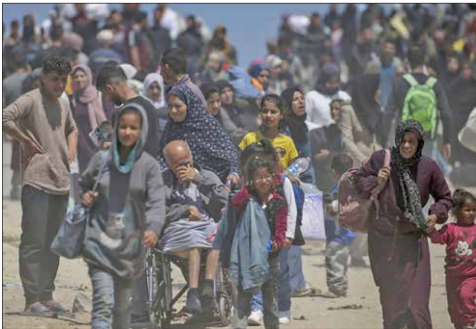
Millones de palestinos son desplazados de su tierra

Pero las masas palestinas resisten aisladas. Es que funciona, al igual que para las masas sirias lo fue la conferencia de Ginebra, una conferencia de China donde se reunieron todas las burguesías de la