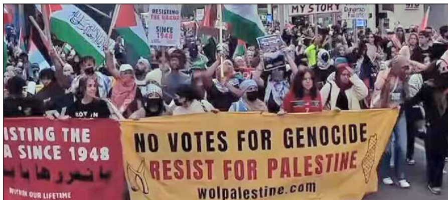
La juventud pro-palestina gana las calles en EEUU el día de las elecciones: "¡Ningún voto para el genocidio!"

Viene a terminar el trabajo de Biden redoblando el ataque a la clase obrera y el saqueo a los pueblos oprimidos