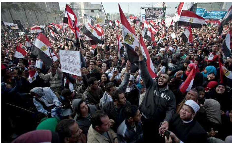
Inicio de la revolución en 2011 en Egipto

Mientras esto sucedía, en el mismo año 2008 estalló una brutal crisis económica donde cayeron todas las bolsas y los grandes bancos norteamericanos. Pero no solo esto, sino que los bancos europeos que tenían el 70% de sus inversiones puestas en Wall Street, también quedaron golpeados por esta crisis. Enseguida vaciaron los tesoros de los estados de Europa para salvar sus pérdidas y lanzaron un brutal ataque a la clase obrera de los países del viejo continente para reponer los déficits. Así vi-