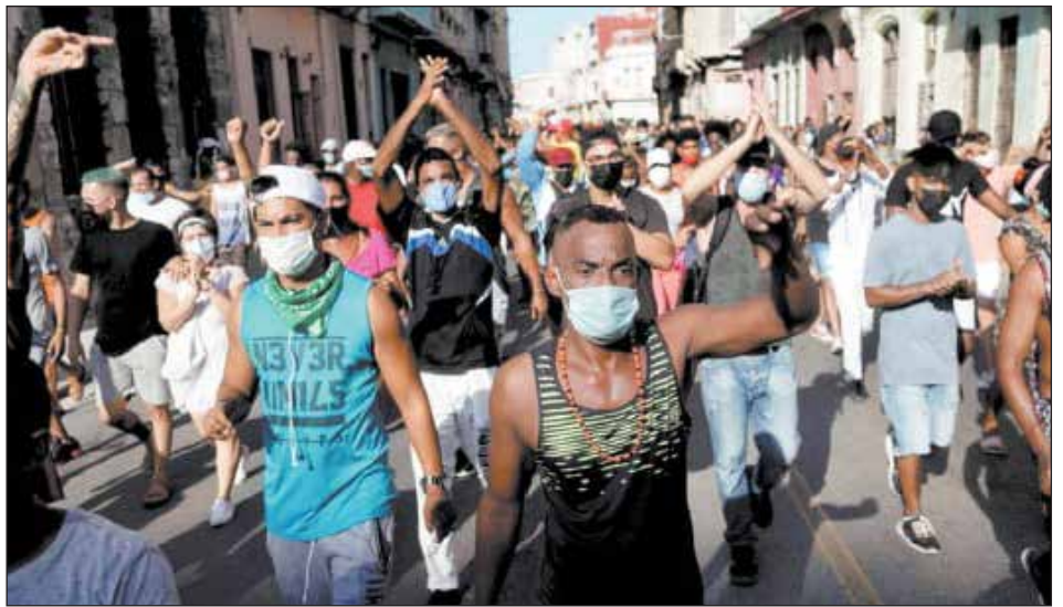
Cuba: levantamiento por el pan el 11J de 2021

Impactado por su experiencia en Argentina, García Hernández ha afirmado en el encuentro en Buenos Aires (para escapar-se de toda lucha por el "derrocamiento violento" del régimen stalinista burgués), que en la isla se podría "formar un movimiento piquetero" de los trabajadores desocupados en la Cuba capitalista. Este hombre, en lugar de pelear por conquistar comités de fábrica, comités de desocupados y comités de soldados y poner en pie una dirección revolucionaria para preparar y hacer una nueva revolución, busca hacer un "movimiento de desocupados". Está claro por qué. Él y sus amigos buscan transformarse en intermediarios entre el gobier-