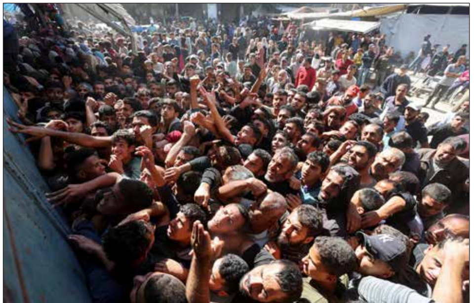
Las masas palestinas de Gaza marchan sobre los comercios en busca de pan

En cambió una dirección burguesa impide la expropiación. En palabras de Trotsky: “La guerra civil, en la que tiene importancia la fuerza de la violencia, exige un supremo compromiso de los participantes. Los obreros y campesinos no son capaces de asegurar la victoria sino cuando luchan por su propia emancipación. En estas condiciones, someterlos a la dirección de la burguesía, es asegurar de antemano su derrota en la guerra civil.” (La lección de España, la última advertencia, 1937, negritas nuestras)