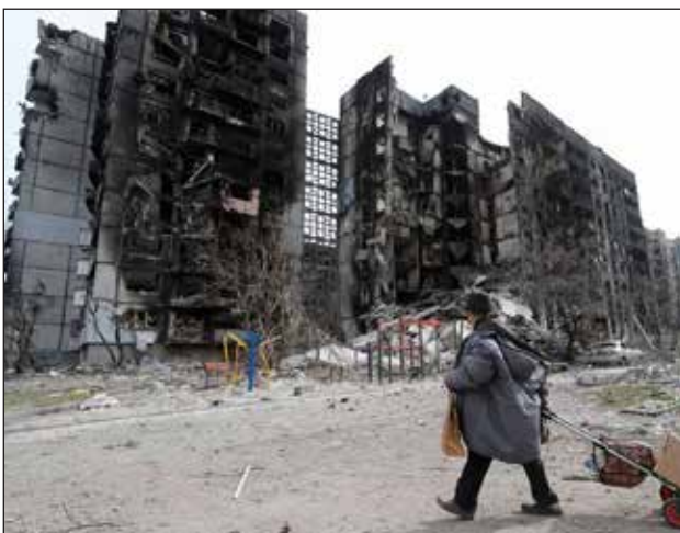
Ucrania devastada por la ocupación rusa

Este “invitado de honor” de las jornadas de Buenos Aires viene de haber estado años militando junto a Corbyn en el Partido Laborista Inglés, el socio de los tories de la City de Londres y la OTAN. No extraña entonces que su partido esté también en esa cueva de bandidos de la burguesía mi-