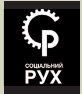
Logo de la organización “Movimiento Social”

En una reunión realizada en el frente de batalla ucraniano del “Movimiento Social”, organización de la clase obrera ucraniana, de la cual participamos desde el Organizador Obrero Internacional,