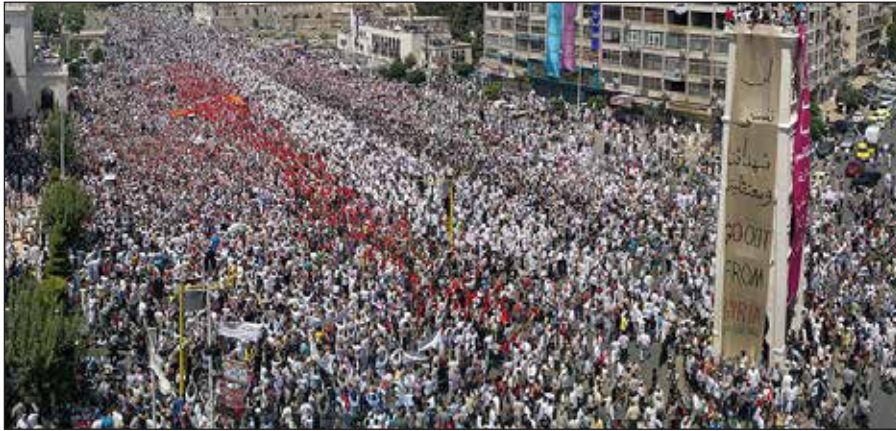
2011: movilización en Hama en el inicio de la revolución siria

Un inmenso placer hablar en una ocasión tan importante en presencia de revolucionarios resilientes que continúan luchando por la clase oprimida en momentos que se intensifican los ataques contra ella (...)