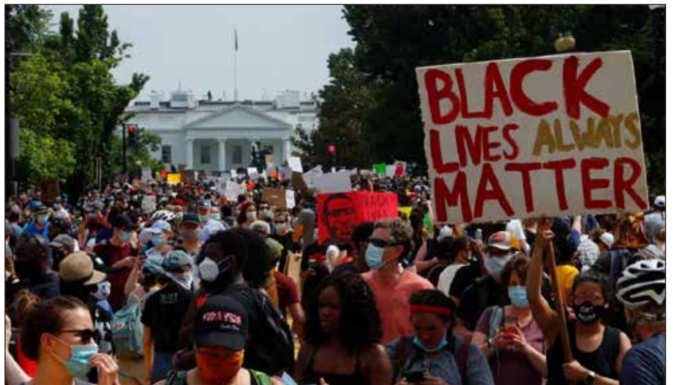
2020: levantamientos revolucionarios de los explotados en EEUU

De verdad, todo obrero serio, mínimamente perspicaz, se dará cuenta que esta gente intenta tapar el sol con un dedo. Ocultan que son los sirvientes de Mélenchon en Francia, que apoyaron “crítica-