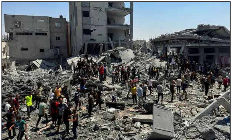
Holocausto en Gaza

Por guerra civil nos referimos en el sentido planteado por Trotsky: “la guerra civil constituye una etapa determinada de la lucha de clases, cuando ésta, rompiendo los marcos de la legalidad, viene a ubicarse en el plano de un enfrentamiento público y en cierta medida físico, de las