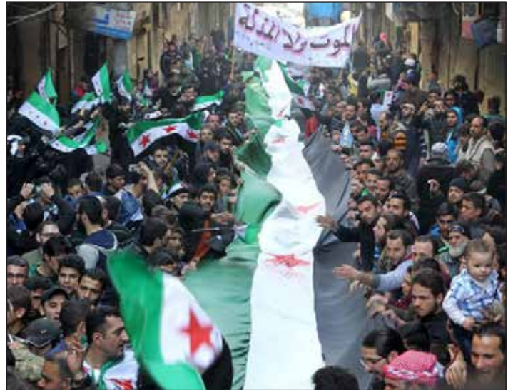
2016: las masas sirias se manifiestan contra el fascista Al Assad

El problema para el imperialismo era que si caía el estado burgués en Siria, se avanzaba a combatir junto a las masas palestinas para expulsar el Estado sionista. Esa revolución triunfaba en Jeru-