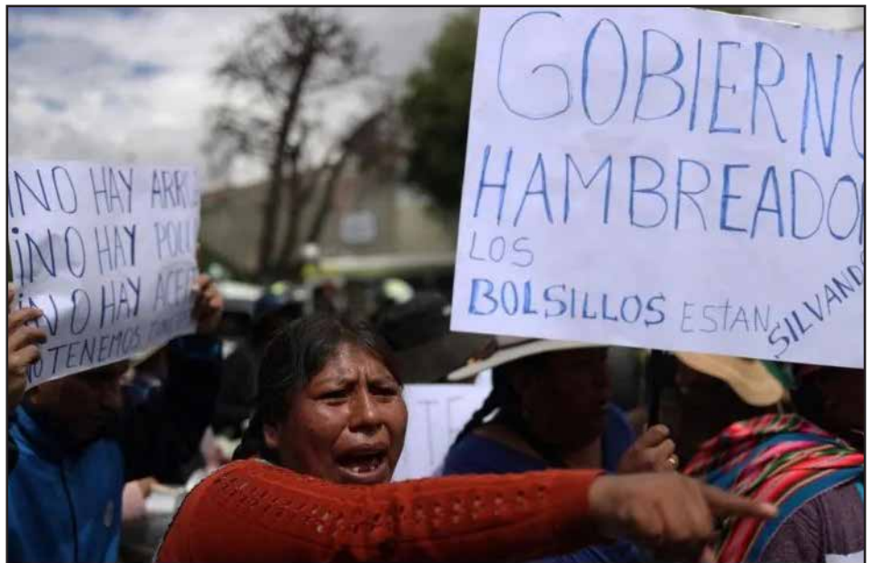
Protestas contra la carestía de la vida

Anticipando el posible derramamiento de sangre, los campesinos ocuparon tres regimientos tomando de rehenes a militares e hicieron vigiliias en distintos cuarteles para que sus hijos no vayan a reprimirlos. Pues en la base del ejército están los hijos de la clase obrera y el campesino pobre bajo armas. La situación se le escapó de las manos a Morales, y Arce blindándose aún más, mandó a reprimir los bloqueos a la policía (a quien les dio un bono de incentivo y buen