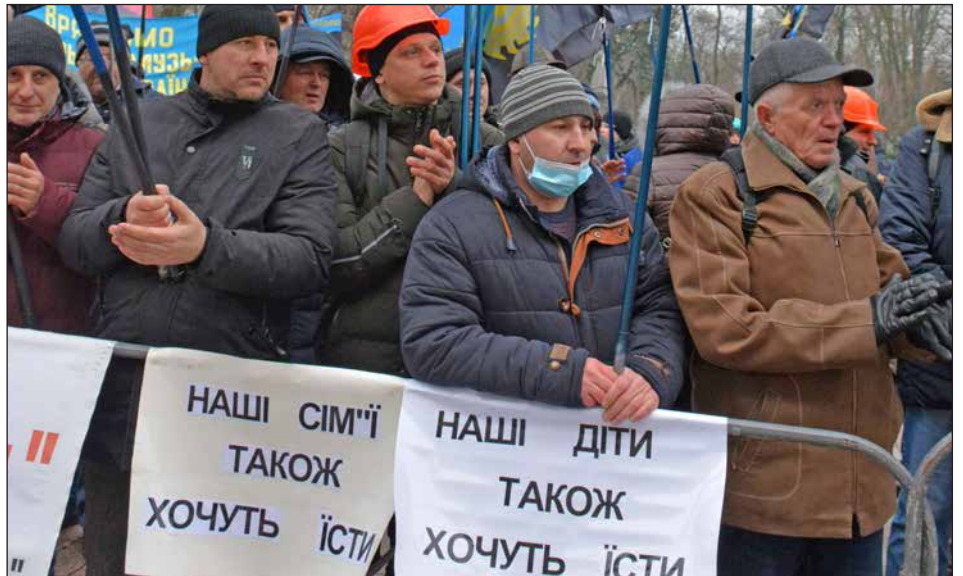
Protesta minera en Ucrania: “Nuestros hijos también quieren comer” (2022)

En Palestina , están las corrientes que condenaron los “métodos terroristas” de Hamas y le dieron “condolencias” al sionismo, como hizo el PTS, y las que someten a la heroica resistencia palestina y la enorme solidaridad internacional contra el genocidio de Netanyahu y Biden, a los pies de la teocracia iraní que ha cercado Gaza y busca imponer la rendición del heroico pueblo palestino.